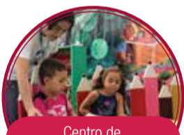
Centro de Formación e Innovación para el Maestro $36.000 millones