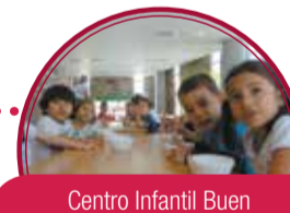
Centro Infantil Buen Comienzo en I.E. Francisco Luis Hernandez (Ciegos y Sordos) $1.200 millones