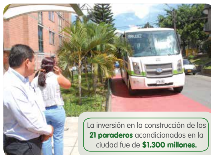
La inversión en la construcción de los 21 paraderos acondicionados en la ciudad fue de $1.300 millones .

Las obras contemplan intervenciones integrales en las que se mejoran los pavimentos para las cargas de frenado y arranque de buses, así como la renovación del espacio público con pisos en concreto, adoquines, losetas táctiles, rampas de acceso, adecuación de zonas verdes, amoblamiento urbano y la señalización.