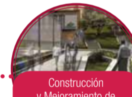
Construcción y Mejoramiento de espacios Públicos en proyectos habitacionales $10.000 millones