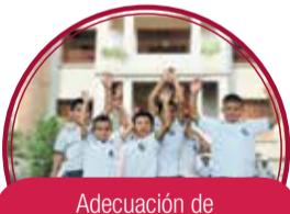
Adecuación de Escenarios I.E. Francisco Luis Hernandez (Ciegos y Sordos) $1.750 millones