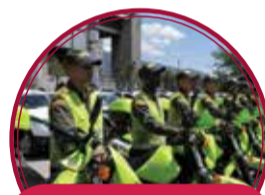
Estación de Policía Aranjuez $12.000 millones