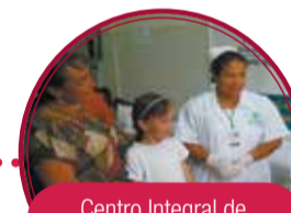
Centro Integral de Servicios Ambulatorios para la Mujer y la Familia $18.382 millones