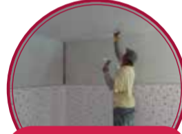
Mejoramiento de vivienda $2.500 millones