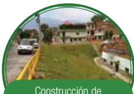
Construcción de las obras civiles en la quebrada El Aguacate $2974 millones