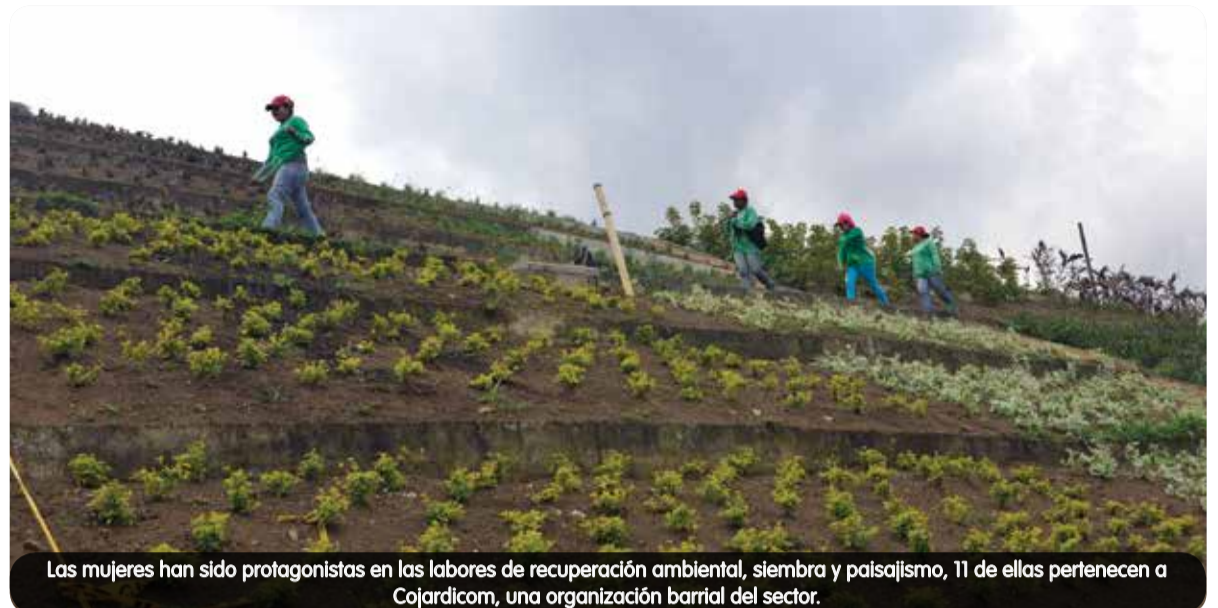
Las mujeres han sido protagonistas en las labores de recuperación ambiental, siembra y paisajismo, 11 de ellas pertenecen a Cojardicom, una organización barrial del sector.

Apoyo académico y técnico para consolidar organizaciones y liderazgos fuertes que convoquen a los habitantes a construir el desarrollo de su territorio.