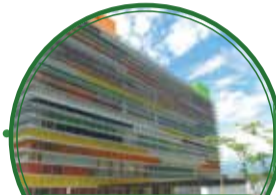
Hospital Infantil Concejo de Medellín $40.000 millones