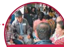
Centro de Integración Barrial Campo Valdés $1.200 millones