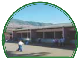
Ampliación de la I.E. San Agustín $2.072 millones