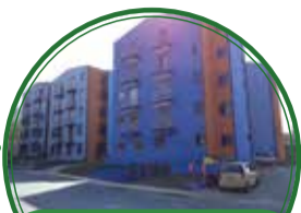
OPV-Nuevo Amanecer (9 viviendas) $355 millones