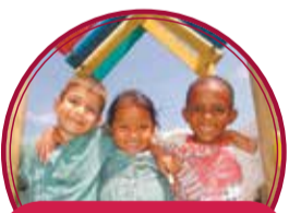
Ampliación del Jardín Infantil Mamachila $1.500 millones