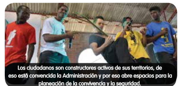
Los ciudadanos son constructores activos de sus territorios, de eso está convencida la Administración y por eso abre espacios para la planeación de la convivencia y la seguridad.

En los encuentros se expusieron las problemáticas priorizadas y el plan de acción, según la oferta contenida en el Plan Integral para la Seguridad y la Convivencia PISC, para atender dichas situaciones, las cuales requieren la intervención coordinada de varias dependencias de la Administración Municipal.