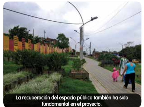
La recuperación del espacio público también ha sido fundamental en el proyecto.

Con los anteriores componentes, la intervención se traduce en mejoramiento de las condiciones de vida de los habitantes del barrio Moravia, el más densamente poblado de Medellín con 829,80 habitantes por hectárea. La gestión de la Alcaldía no ha sido solamente de tipo ambiental, sino que sus acciones se han enfocado en generar una transformación social y cultural.