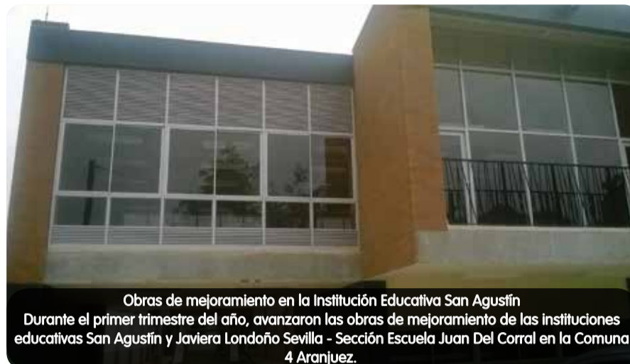
Obras de mejoramiento en la Institución Educativa San Agustín Durante el primer trimestre del año, avanzaron las obras de mejoramiento de las instituciones educativas San Agustín y Javiera Londoño Sevilla - Sección Escuela Juan Del Corral en la Comuna 4 Aranjuez.

La ampliación de la I.E. Javiera Londoño Sevilla - Sección Escuela Juan Del Corral contará con nueve aulas, dos preescolares, restaurante y nuevas unidades sanitarias. Inversión: $5.749 millones .