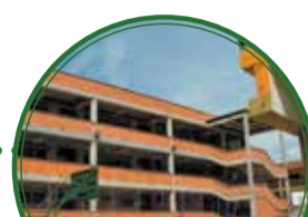
I.E. Jose Eusebio Caro $2.753 millones