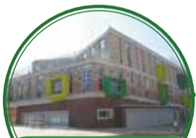
Jardín Infantil Buen Comienzo Moravia $6.537 millones